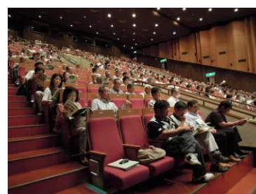
多くの方にご参加いただきました