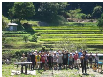
コンサートは、地元小学校の生徒にも参加していただきました